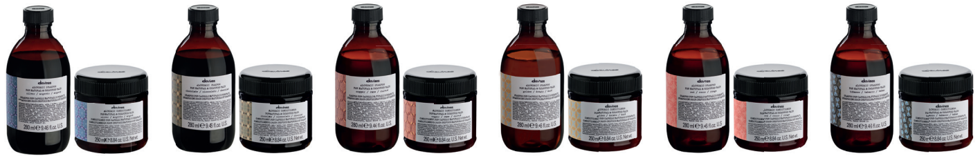
SILVER SHAMPOO & CONDITIONER

Conditioner: Ürünü şampuanlanmış, havluyla kurutulmuş veya kuru saça uygulayın, boyamak istediğiniz alandaki saça ürünün tam doygunluğunu sağlayın. Gerekli ürün miktarı, saçın uzunluğuna ve gözenekliliğine ve seçilen uygulama türüne (havluyla kurutulmuş veya kuru saç, tam kafa veya kısmi uygulama, seçilen yaratıcı teknikler vb.) göre değişir. 20 dakikaya kadar işlem. İyice durulayın.